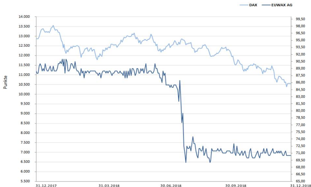
Abbildung 1: Kursentwicklung der Aktie der EUWAX Aktiengesellschaft 2017 im Vergleich zum DAX® (auf Basis der Schlusskurse)

Der Kurs der EUWAX Aktie bewegte sich auf Jahressicht in einer Spanne zwischen 70,00 € und 91,00 €. Im Zeitraum Ende Juli bis Anfang August kam es zu einem deutlichen Kursverlust von -15 %, wovon sich die Aktie im Laufe des Geschäftsjahres nicht erholen konnte. Als Ursache für den Rückgang wurde ein kurzfristig erhöhtes Handelsvolumen der Aktie ermittelt. Ein besonderer Auslöser hierfür konnte nicht ausgemacht werden. Zum Jahresende lag der Kurs der Aktie bei 70,50 € (Vj. 89,00 €), was einer Jahresperformance von -21 % entspricht.